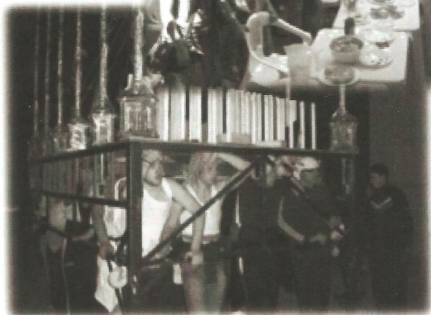
Ensayo costaleros de la Virgen de la Caridad