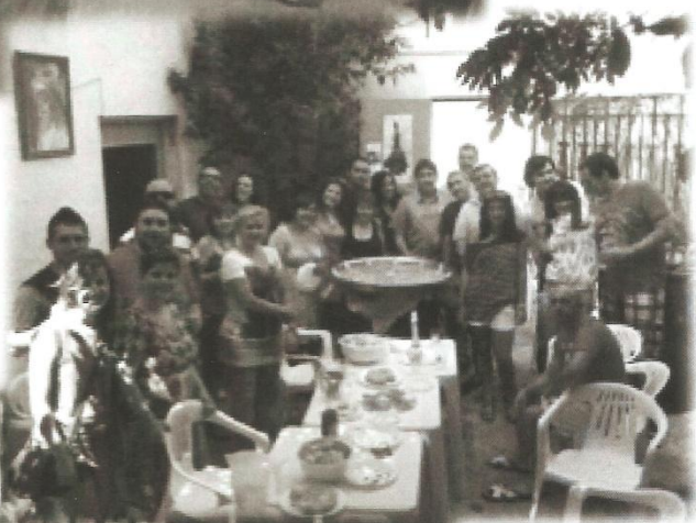
Paella de hermandad