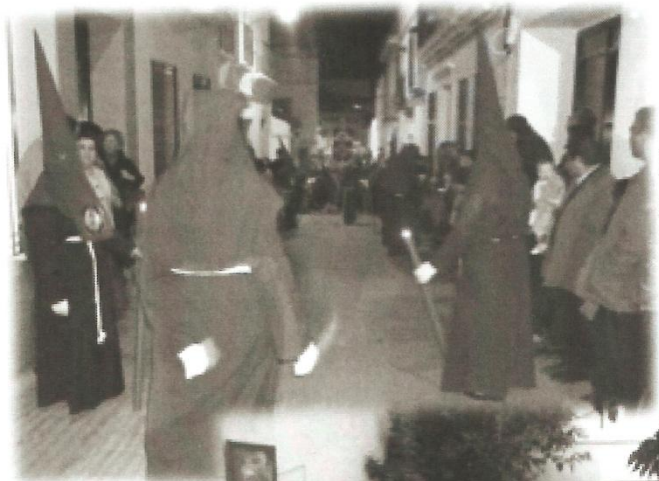
Nazarenos desfile procesional Martes Santo